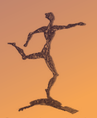
Grand prix provincial à l'exportation 1997